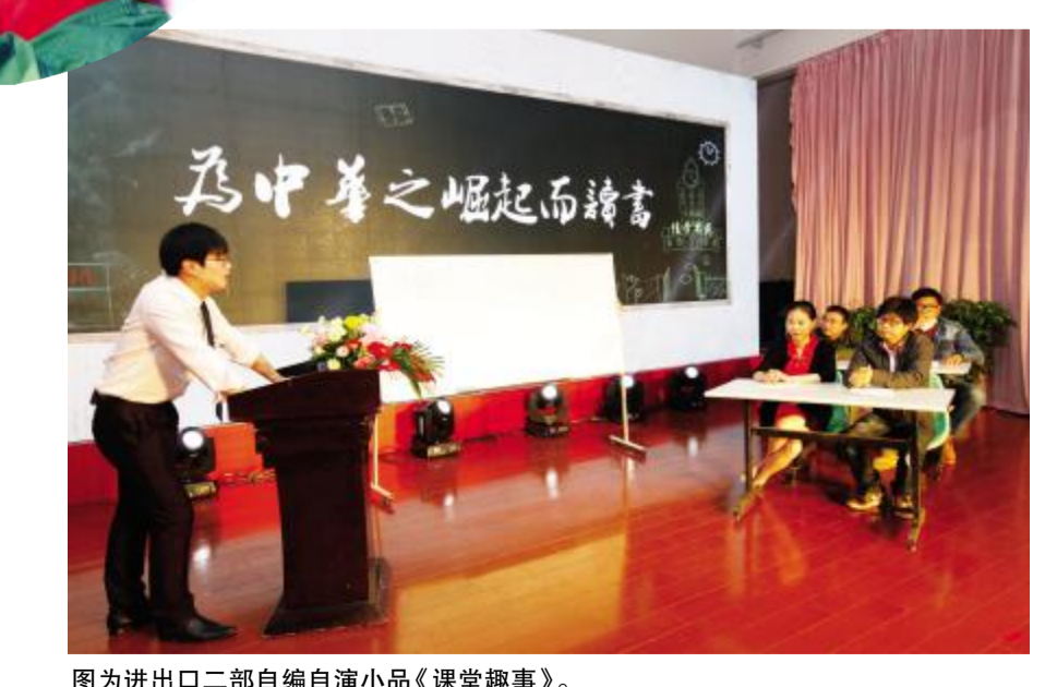
图为进出口二部自编小品《课堂趣事》。