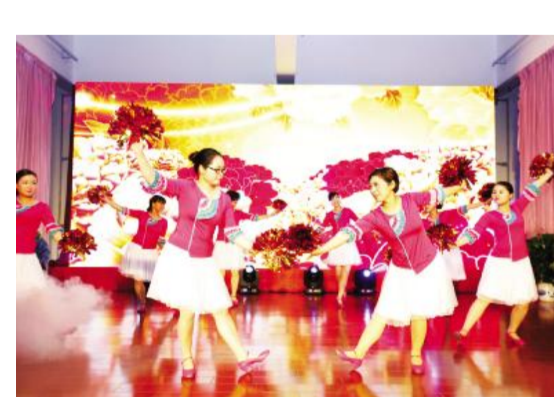
图为公司舞蹈团表演开场舞《红包》。