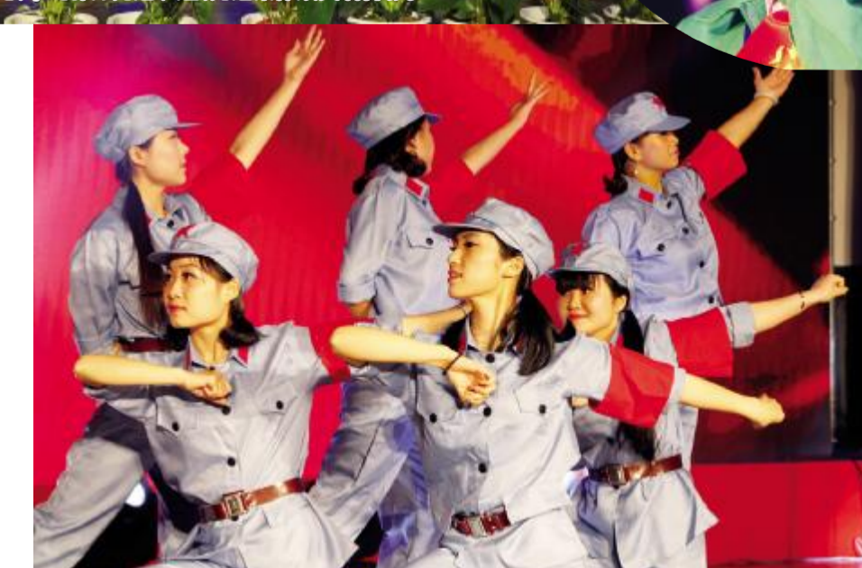
图为公司舞蹈团表演舞蹈《红色娘子军》。