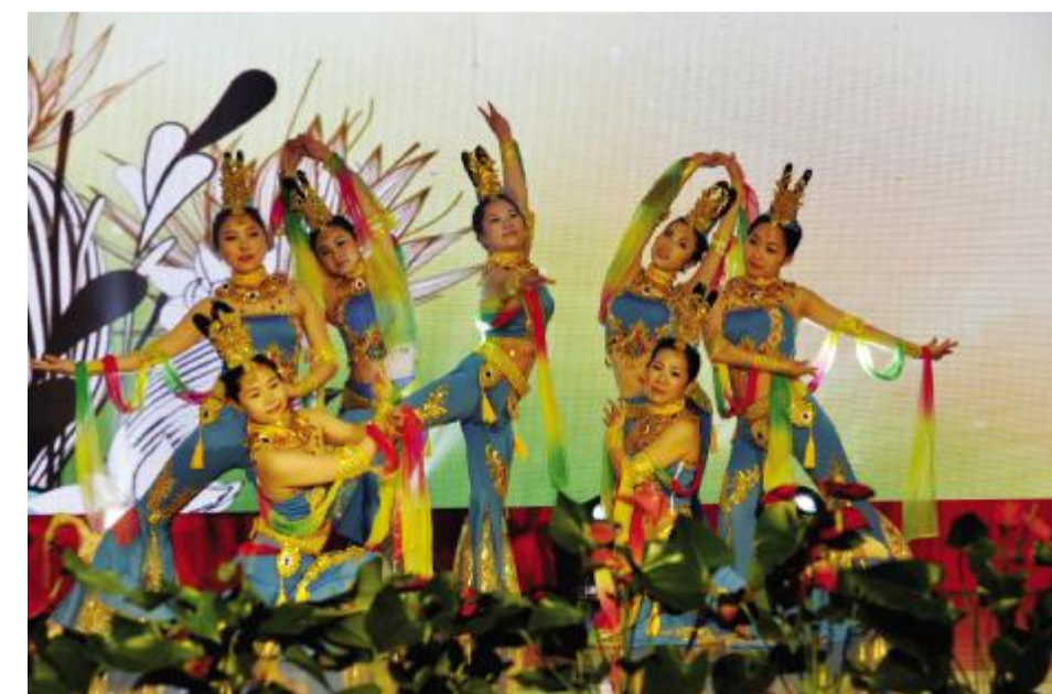
图为公司舞蹈团表演舞蹈《飞天》。