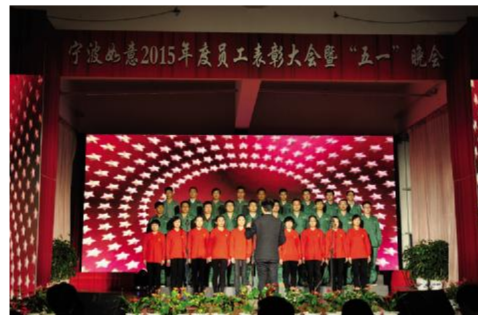
图为公司合唱团大合唱《咱们工人有力量》《如意之歌》。